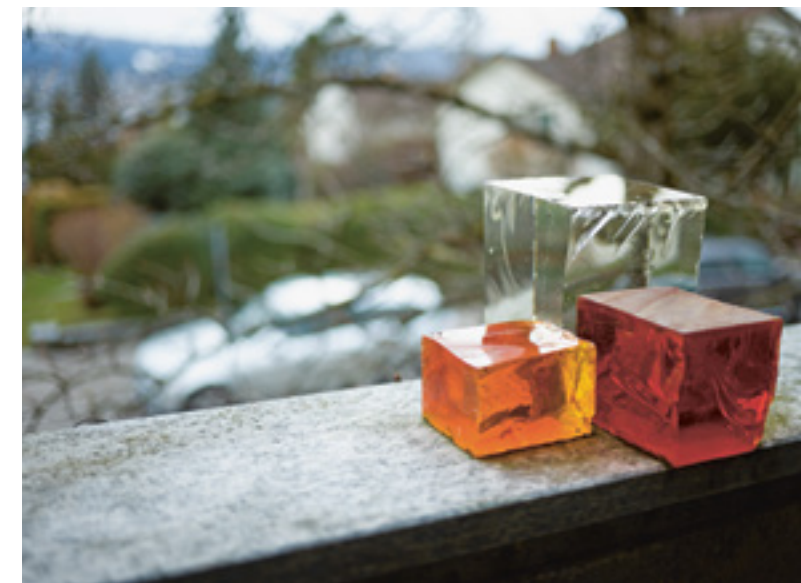
Ⓞ Bei den Glaskuben auf der Terrassenbrüstung handelt es sich um optisches Glas. Daraus werden hochwertige Linsen und farbige Lichtfilter hergestellt.

lerne er mehr. Viele namhafte Designer kümmern sich lediglich um eine modische Verpackung. Nehmen wir als Beispiel die Olivetti Valentine von Ettore Sottsass. Neu an der Schreibmaschine war eigentlich nur die Karosserie – das knallrote Gehäuse und der Koffer. Die Mechanik entsprach mehr oder weniger dem Vorgängermodell von Marcello Nizzoli. Es wäre viel zu teuer gewesen, all das neu zu entwickeln. Bei mir unten im Flur steht eine Valentine. Stell mal eine Hermes Baby aus Schweizer Produktion daneben – das ist Mechanik pur in einem Blechkoffer. Die Maschine kann genau das Gleiche wie die Valentine, ist aber 30 Jahre älter und nicht mit dem Namen eines Entwerfers verbunden. Und wahnsinnig schön, was für eine Ästhetik!