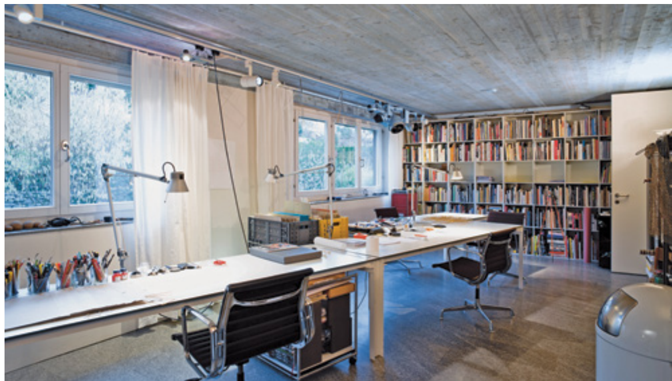
Ⓞ Das Arbeitszimmer mit Blick in den Garten. Am langen Arbeitstisch entstehen seit Jahren Clivios Entwürfe. Eine Werkstatt befindet sich überdies im Keller.