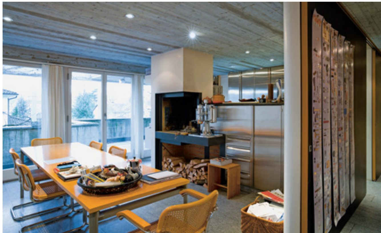
Ⓞ Esstisch mit Blick in die Küche: Die Küche selbst stammt nicht von einem prominenten Hersteller, setzt nicht auf den Show-Effekt. Es handelt sich um eine robuste professionelle Ausstattung aus dem Gastronomiektor.

lichem Grund habe ich hier in meinem Haus Regale ohne gestalterischen Anspruch installiert. Als Objekte interessieren mich Regale nicht. Wäre es möglich, Bücher in der Luft aufzustellen, würde ich das bevorzugen.